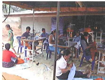
Resa vid symaskinen, sömnadsundervisning i BanPhaTai.