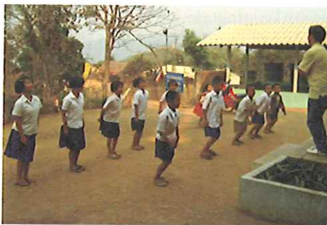
Läraren i BanPhaKui med sina elever

Kids Ark har startat denna förberedande skola, och tack vare denna har hela byn fått en framtidstro.