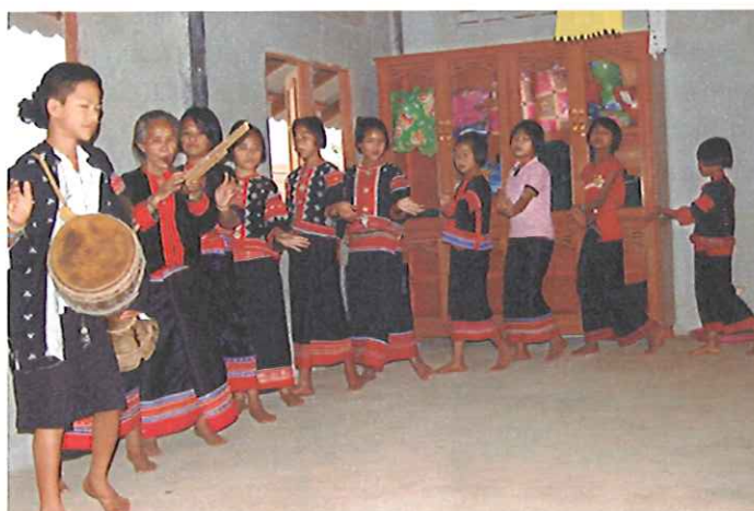
Traditionell dans uppförd vid vårt besök i BanPongHii. Både gamla och unga deltar i dansen