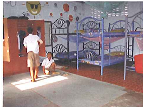
Lärarassistenten i Thatoon, som vi avlönar, samt bild från pojkarnas övernattningsrum